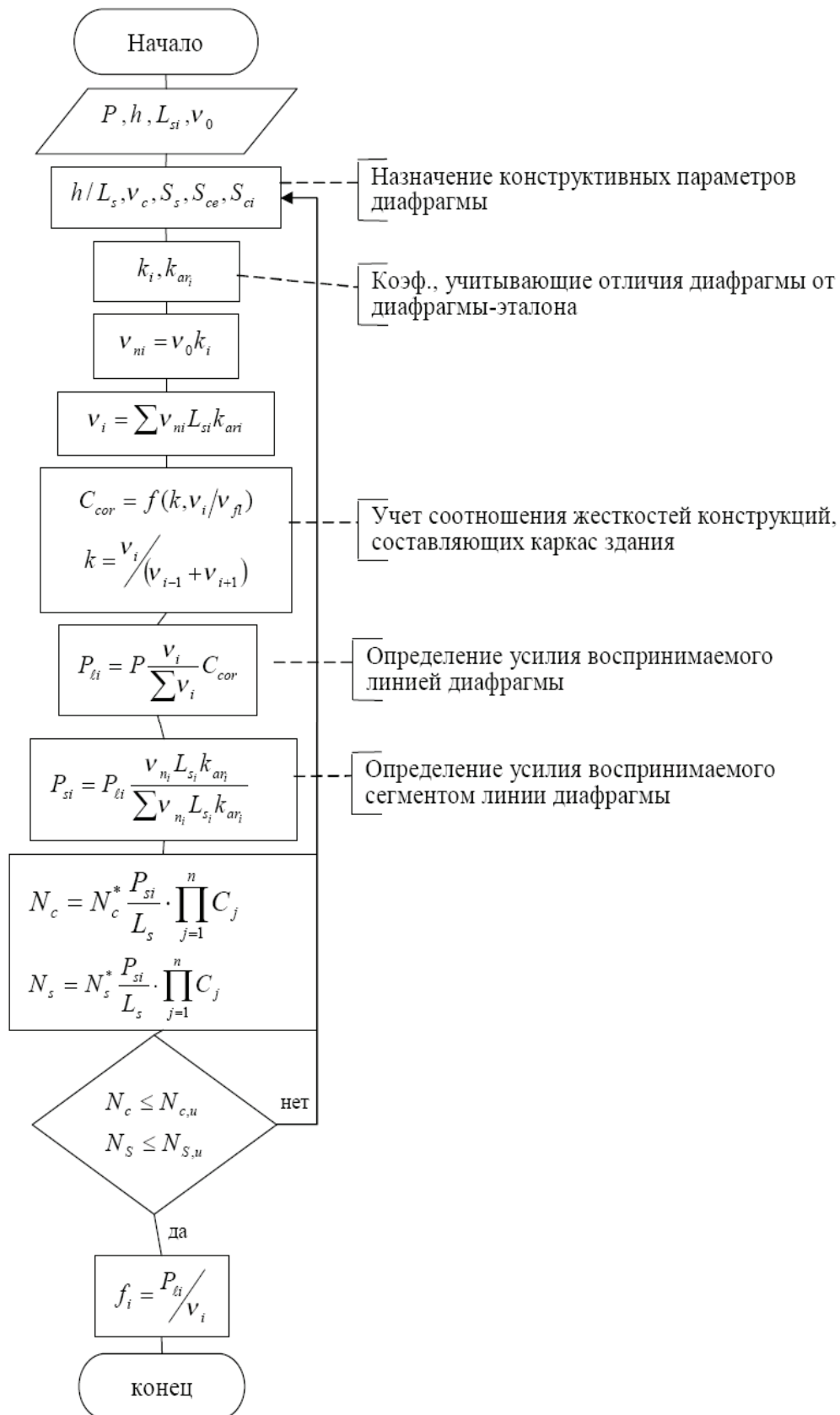
Рисунок 2 – Схема оценки пространственной жесткости каркаса здания из ЛСТК

1. Исходя из принятого объемно-планировочного решения определяется горизонтальная нагрузка на перекрытие (покрытие), а также общие геометрические характеристики сегментов линий диафрагм (высота/длина), их количество, расположение.